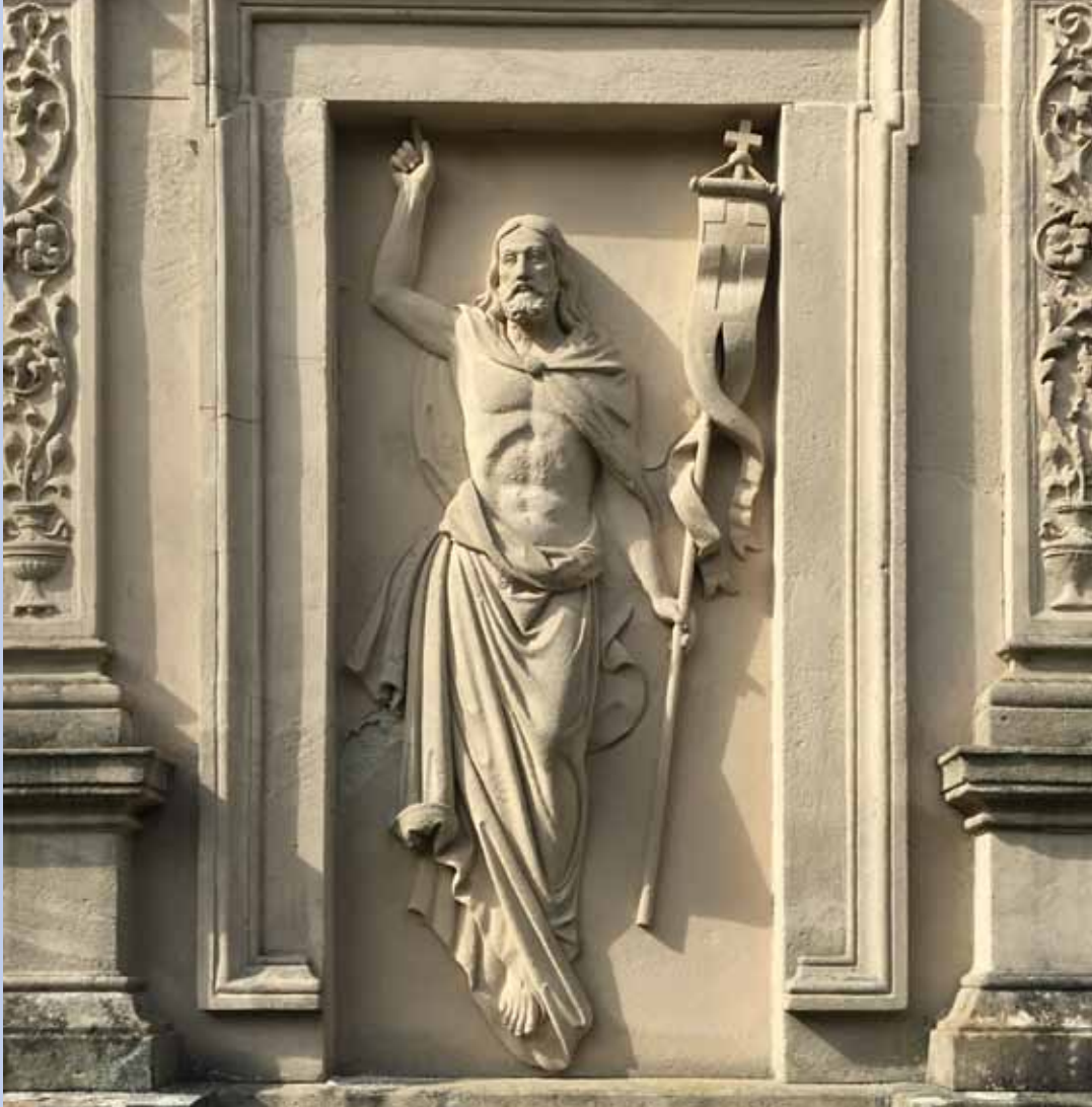
Grab auf dem Kapellenfriedhof in Bad Kissingen

CORONA – UND WIE ES WEITERGEHT ANDACHTEN FÜR DIE ZEIT UM OSTERN