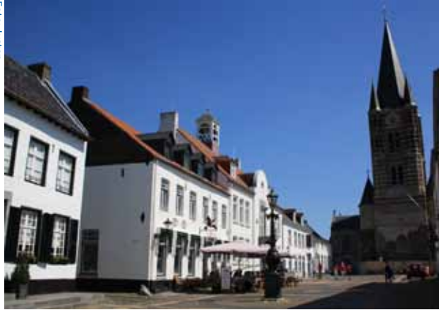
Sie prägen das Stadtbild von Thorn: Die Abteikirche und die weißen Häuser

men diese Steuer nicht bezahlen konnten, verkleinerten sie ihre Fenster oder mauerten sie ganz zu. Anschließend wurden die Häuser weiß gestrichen, um den Unterschied zwischen alten und neuen Steinen zu verbergen.