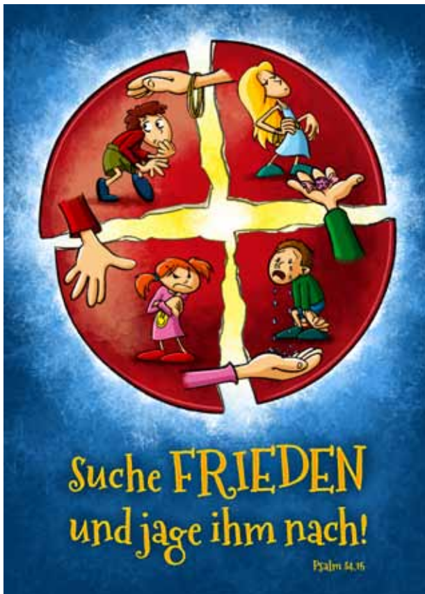
Grafik: Uli Gutekunst