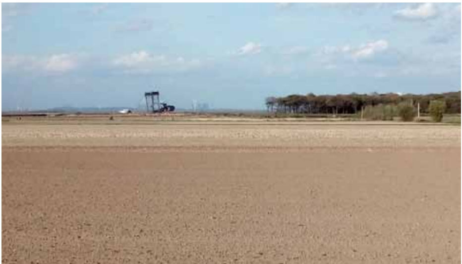
An den Resten des Hambacher Forstes